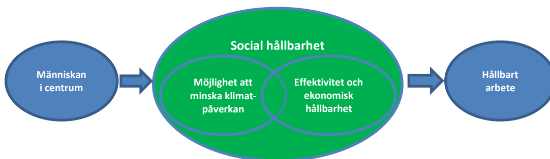
Figur 1. Tre dimensioner av hållbarhet

De önskade effekterna av Produktion2030:s 15:e utlysning är ökad social hållbarhet i tillverkningsindustrin. Samtidigt ska företagens ekonomiska och klimatomfattiga hållbarhet bibehållas eller öka. Vi förutsätter att en mänskligt centrerad och socialt hållbar arbetsituation ger de anställda goda förutsättningar att skapa ökad produktivitet och minskad klimatpåverkan.